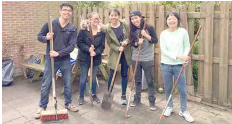
Twintigers van de Chinese Evangelische Kerk knappen een tuin op.

Dit jaar viert Stichting Present Zoetermeer haar vijfjarig jubileum. Dat betekent: vijf jaar lang een brug slaan tussen mensen die hulp nodig hebben en mensen die graag een keer iets voor iemand willen doen.