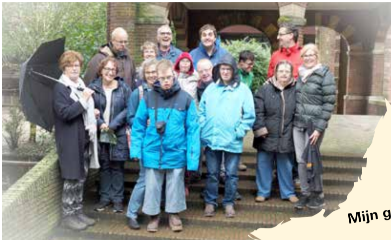
De ICVG Bijbelclub in Avifauna

IMPRESSIE • Iedere woensdagavond komen mensen met een verstandelijke beperking naar de Bijbelclub van de ICVG (Interkerkelijke Commissie voor geestelijke verzorging van Verstandelijk Gehandicapten). Er wordt gezongen, er is een mooi bijbelverhaal en ook – heel belangrijk – is er de pauze met iets lekkers te drinken en tijd voor een praatje.